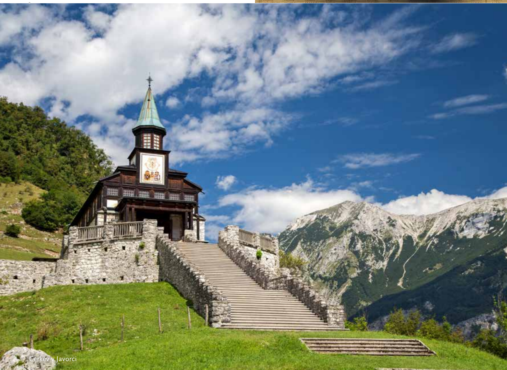
Cerkev v Javorci

Vsak od muzejev na prostem, ki hranijo ostaline soške fronte, priča o tem, kako pomemben igralec v vojni je bila narava. Kolovrat je med najpogosteje obiskanimi in najlažje dostopnimi točkami prve svetovne vojne. Greben, ki se razteza vse od Kobarida do Brd in ponuja izjemne poglede na Julijske Alpe in smaragdno Sočo na eni strani ter na Benečijo, Furlansko nižino in Jadransko morje na drugi, je privlačen tudi za kolesarje. Tu je potekala italijanska obrambna črta s še danes ohranjenimi poveljniškimi mesti, strelskimi položaji, mrežo jarkov in kavern. Ta muzej je poseben tudi zato, ker je v dveh državah hkrati – Sloveniji in Italiji.